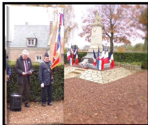
11 novembre 2019

Les cérémonies aux Monument aux Morts ont été suivies d'un vin d'honneur à la salle des fêtes comme chaque année. La cérémonie du 8 mai a été l'occasion de présenter le nouveau drapeau de l'association des Anciens Combattants de la Section Locale de Cramont.