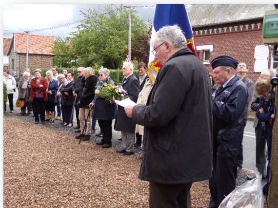
8 mai 2019